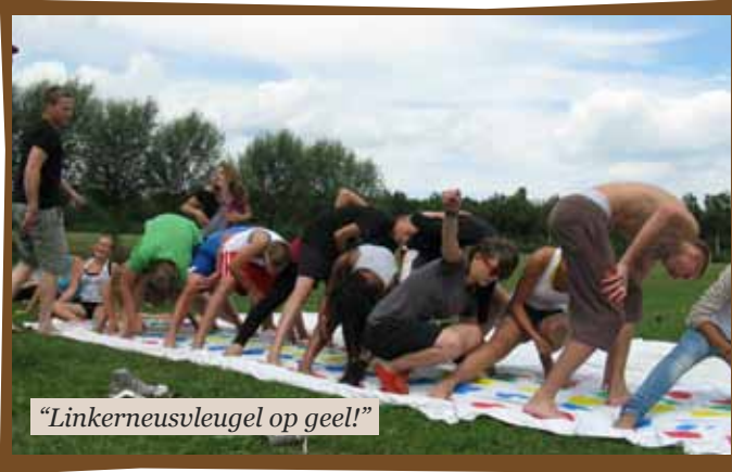
"Linkerneusvleugel op geel!"