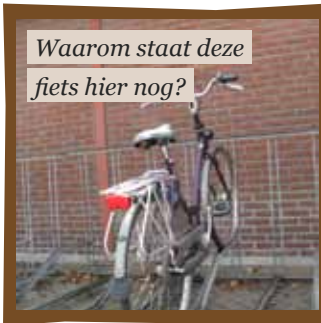
Waarom staat deze fiets hier nog?