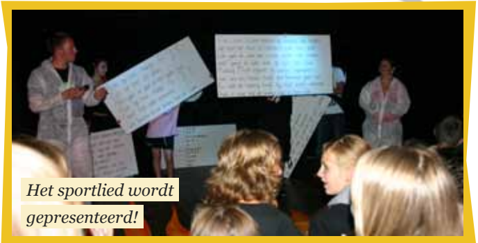
Het sportlied wordt gepresenteerd!

Kortom, genoeg mogelijkheden om die punten te scoren. En uiteraard kunnen jullie ook zelf acties verzinnen om punten te behalen, kom dan gezellig even langs in het sporthok!