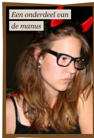
Een onderdeel van de manus