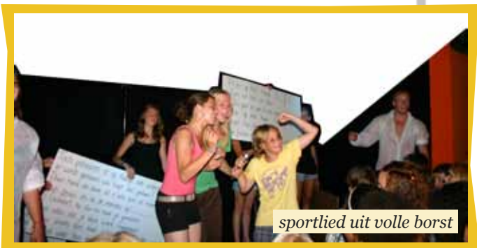
sportlied uit volle borst

Dan zeggen wij nu weer adios mede sport amigo's. Toedeledoki!!