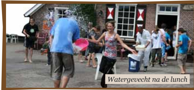
Watergevecht na de lunch