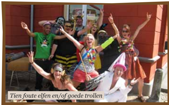
Tien foute elfen en/of goede trollen