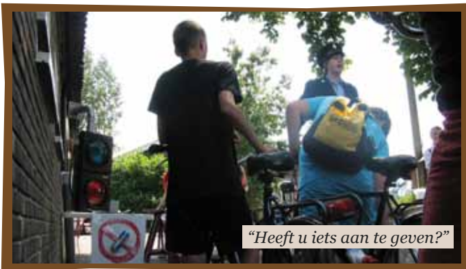
"Heeft u iets aan te geven?"

Deze envelop zou wel eens het antwoord kunnen geven op de vraagtekens die zondag om 13:59 in 'De Dag Van Van-dag' werden gesteld bij een fiets die achterbleef op het plein tijdens een eerste fietstocht naar de Vecht.